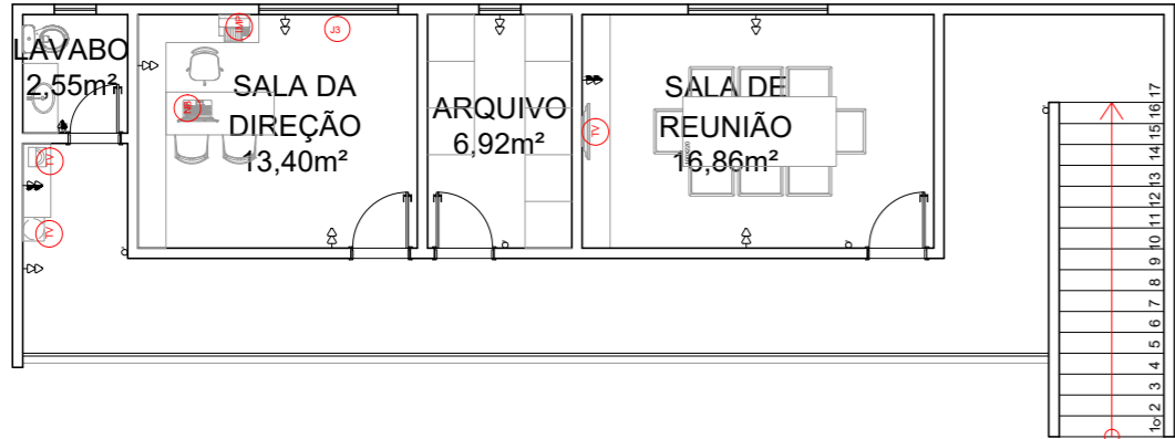
2 PLANTA DE LAYOUT - MEZANINO 1:120